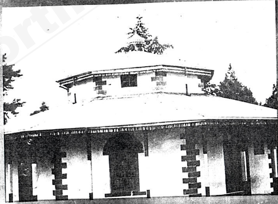
አዲስ አበባ የምትገኘው የመንበረ ንግሥት ቀስቋም ቤተ ክርስቲያን።