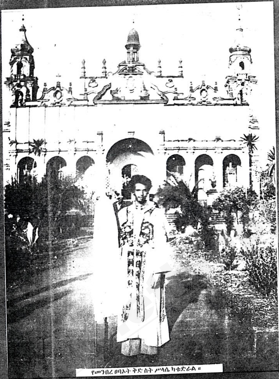
የመንበረ ዐባነት ቅድስት ሥላሴ ካቴድራል ል