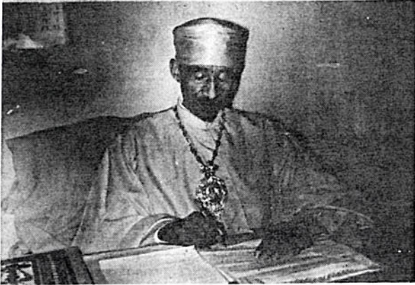
ብጩ ወቅደስ አቡነ ተክለ ገዢ ገጥናት በሥራ ላይ እንዳሉ

ማገበራቸው ጥፋትና ልማት የሚወያዩ የት በሃዘኑ ጊዜ በመሆኑ ነው ። ማለትም በግል በስብሰባ ወቅት ተነጋግረው መፍታት የሚገባቸውን የግል ቅራኔም ሆነ ሂሳና ግለሂስ በድንኳኑ መካከል ተቀምጠው ለቅጥ ደራሹም ሆነ ሌላው አስተዳደር ተዛዘኝግልቃገብቶ ሲጻፍቸውና አስተያየት ሲሰጥ በጠቅላላ የሃዘኑን ቤት ግራ ሲያጋቡት በአብዛኛው ቦታ ይታያሉ ። ፀብና ጭቅጭቅ ሲበዛ ለማገበራዊ ኑሮ ጠንቅ ይሆናልና ሊታሰብበት ይገባል ። በሌላ በኩል ደግሞ የሴት እድር የሥራ ድልድልም ሆነ በግብረት ሥራ ጊዜ የጓደኝነትና እንደ ቅርብነታቸው ሥራውም የዚያን ያህል ቅርብነትና ርቀት ይታያሉ ። የጓደኝነት ሥራ ሞቅ ደመቅ ያለ ሲሆን በጉርብትና በአከባቢነት ብቻ ሆኖ ከመካከላቸው ጓደኛ የሌላት ከሆነች ግን እኩል ከፍላ ሠርታ በዚች ዕድርተኛ ቤት ድንገት ጎዘን ቢያጋጥም ብድሯ አይመለስላትም ይህም ጓደኛ እንዳላቸው ተረኞቻቸው ሆኑ መጻቢዎቹ ቸልተኞች ይሆናሉ ። ይህስ የሚገባ ሥራ ነው ? በኛ አስተያየት እንደዚህ ዓይነቱ ተግባር መለያየትን ስለሚፈጥር ይታሰብበት እንላለን ።